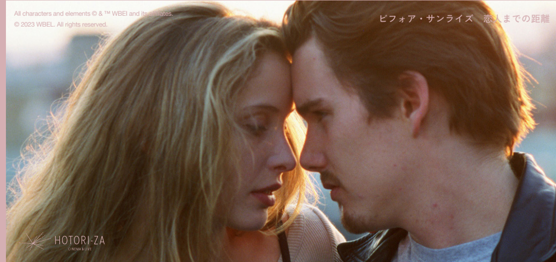
All characters and elements © & ™ WBEL and its affiliates. © 2023 WBEL. All rights reserved.