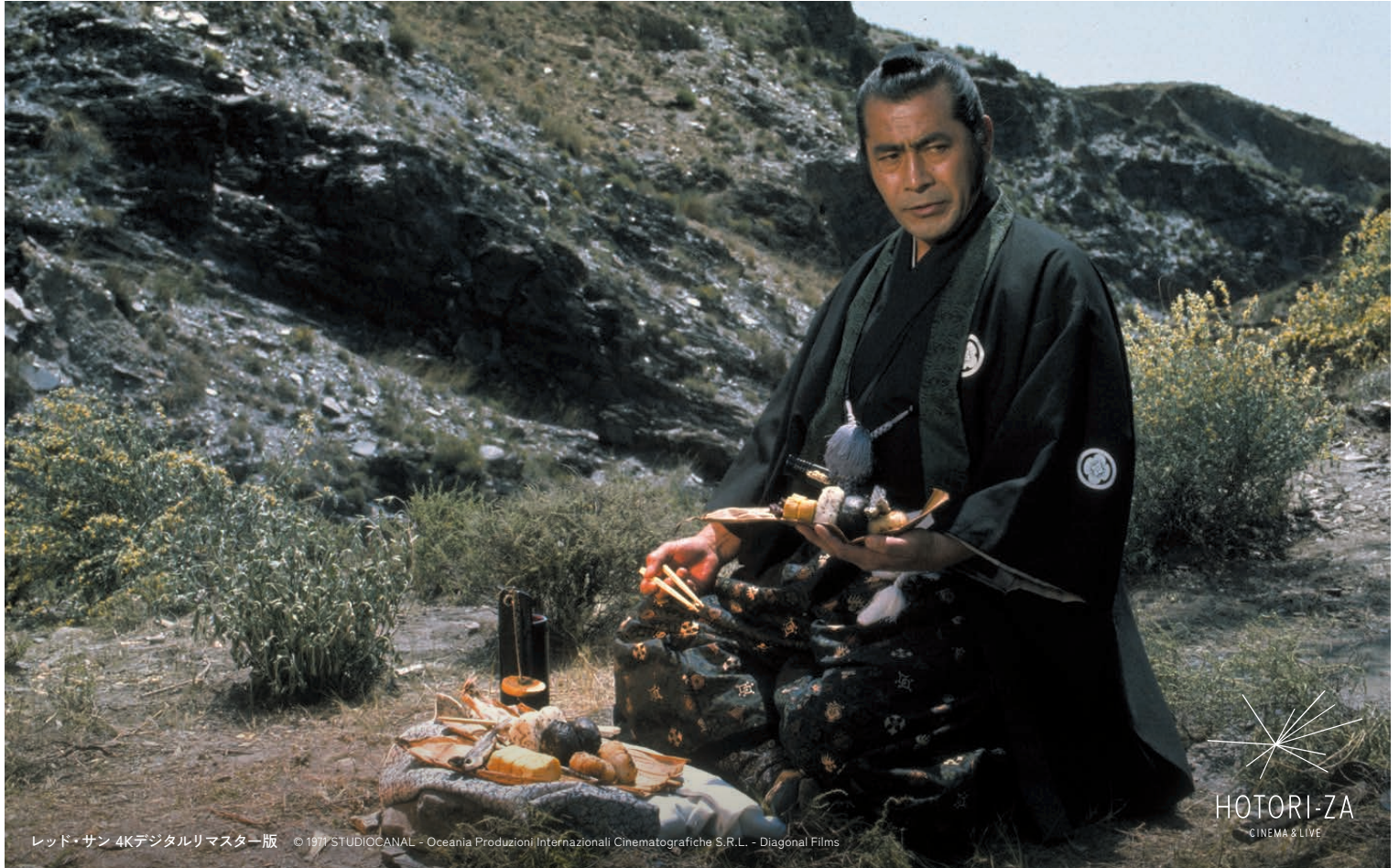
レッド・サン 4Kデジタルリマスター版 © 1971 STUDIOCANAL - Oceania Produzioni Internazionali Cinematografiche S.R.L. - Diagonal Films