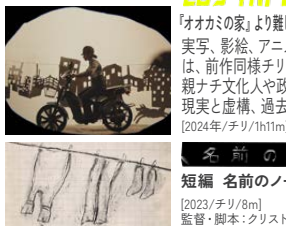
© Leon & Cocita Films, Globo Rojo Films